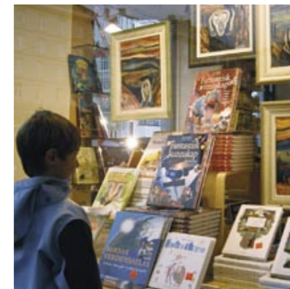
Utstilling av ”Skrik” - bilder i vinduet hos Nordli på Torgallmenningen.

Speil & Ramme i Øvregaten har også åpnet utstilling med et stort utvalg malerier fra Kolibriredet. Denne utstillingen vil stå i en periode framover og her er det også mulig å kjøpe disse unike bildene. Av inntekten går 2/3 til kunstnerens familie og 1/3 til CARF. Her kan dere virkelig gi direkte hjelp samtidig som dere får et kunstverk som berører på flere måter.